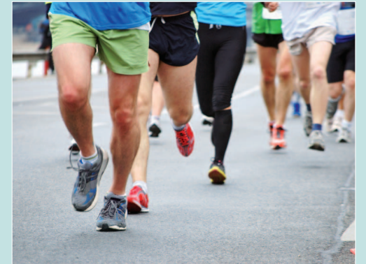
Het begeleiden van sporters bij blessures aan voeten en benen.